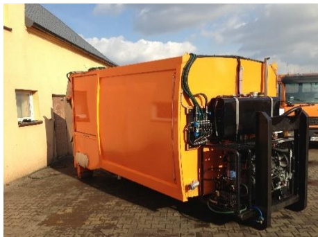
Wersja mobilna pod hakowca