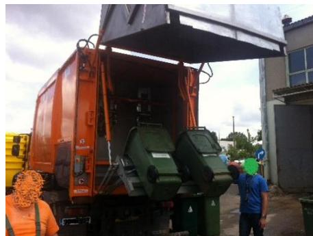
Wersja na podwoziu