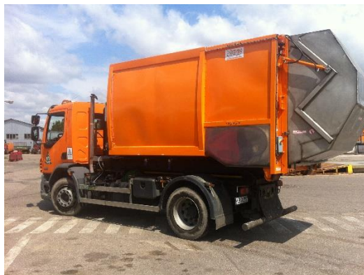
Urządzenie myjące zainstalowane na hakowcu 18DMC

Urządzenie to może być zainstalowane na samochodzie ciężarowym o DMC15t z możliwością dostosowania do sam. hakowego